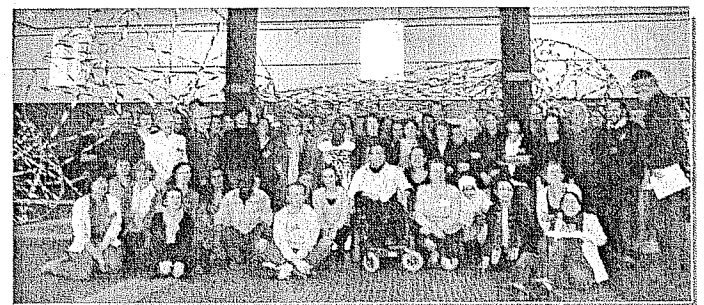
Les participants au séminaire de Nantes

Elle renvoie à la nécessité de « réconcilier » les temporalités (sans les résoudre), « resynchroniser les temps », notamment entre familles, professionnels et élus.